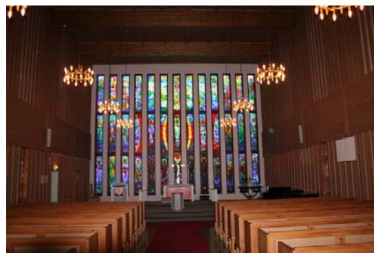
Glassmaleriet i Båtsfjord kirke.

Så starter en historie om glassmaleriet. Diodelys tennes etter hvert som hvert enkelt bilde omtales tilsatt nydelig sakral musikk. Det blir en blanding av lys, musikk og speaker. Når denne er ferdig rulles et stort lerret ned automatisk og vi får en meget vellaget multimedia forestilling om den norske kirkes historie og virke i nord. Her omtales runebommer og i vinklingen "hedens" religion og heksebrenning til dagens moderne kirke. Spesielt interessant er forholdet mellom kirka og fiskere som ofte risikerer livet for å få store fangster.