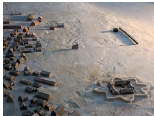
Statens Vegvesen, Nasjonale turistveger: Minnesmerke for ofrene under hekseprosessene.

Totalt vil det gå 1.5 time for å besøke begge stedene.