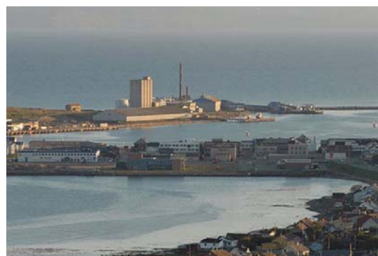
Vadsø med sildefabrikken i bakgrunnen.

Inni tanken er det trebenker i sirkler rundt en scene som ligger midt i sentrum. Lyssettingen er isblå og kald. På scenen ligger 2 mennesker inni en reinskinnsvepose og sover. Disse er Nansen og Johansen på Franz Josefland. Når alle har satt seg, dempes lysene og man hører en forrykende snøstorm og via laser vises snøstormen inn over publikum. I stormen høres en samtale mellom Nansen og Johansen.